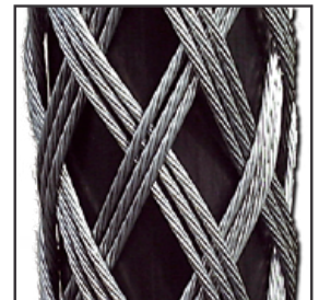
(3-lagig / verstärkt)

RP-700-G: Lieferbar in der Standardlänge 700 mm (500 mm Geflecht 200 mm Kopf) . Andere Längen auf Anfrage! Selbstverständlich auch lieferbar in den Ausführungen: